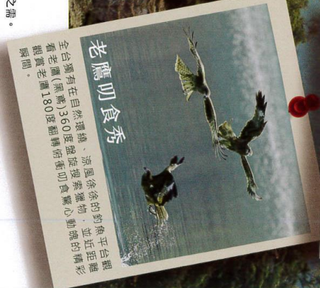
老鷹叨食秀 全台灣有在自然環境、涼風徐徐的釣魚平台觀看老鷹(黑鳶)360度盤旋捕魚驚心動魄的瞬間，觀看老鷹180度翻轉俯衝叨食驚心動魄的瞬間。