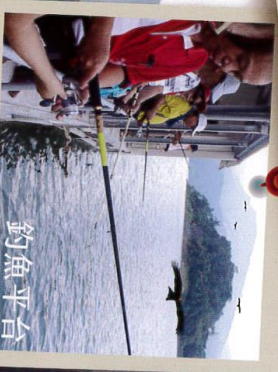
釣魚平台 全台灣唯一合法的水庫釣魚平台，純淨水庫孕育多種豐富魚種，在群山環抱中體驗獨特釣魚公式釣魚法，恣意享受釣魚樂趣，不啻釣魚的朋友來到這裡，保證也可輕易釣到魚囉！