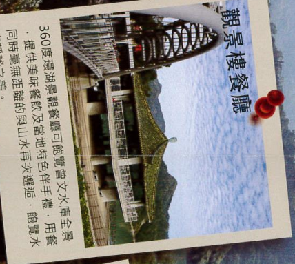
觀景樓餐廳 360度環湖景觀餐廳可飽覽曾文水庫全景，提供美味餐飲及當地特色伴手禮，飽覽水庫靜謐之美。